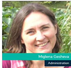
Miglena Gesheva Administration